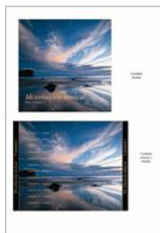
Mi carátula de CD de l...