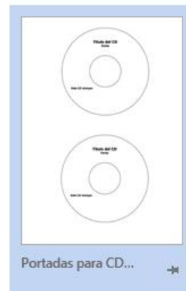
Portadas para CD...