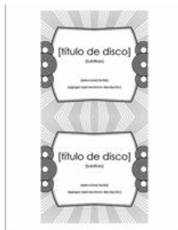
Etiqueta de carátula de CD