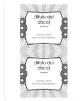
Etiqueta de inserción pa...